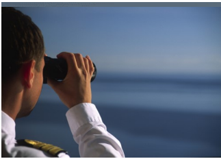
Career paths for seafarers

El Proyecto financiado por Erasmus+ Skills Beyond the Seas comenzó en Diciembre de 2018.